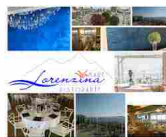
APRE A IMPERIA IL RISTORANTE...