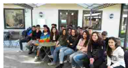
la 2ª agraria del ruffini si aggiudica...