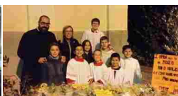
PONTEPASSIO. GRANDE SUCCESSO...