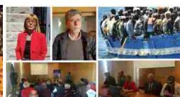
caso migranti. summit in...