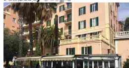
IMPERIA. DOPO 55 ANNI ADDIO ALLO...