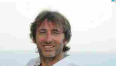
"CERVO IN BLU... D`INCHIOSTRO"....