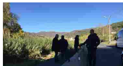
DIANO MARINA. INAUGURATA LA...